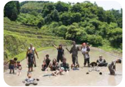
田植えのあとは混合戦!

※公共交通機関をご利用の方は、 JR 羽犬塚駅より「堀川バス」の下記便をご利用ください。 [堀川バス] JR 羽犬塚駅 8:12 発→黒木バス停 9:03 着便 黒木バス停からはスタッフが送迎します(要連絡)